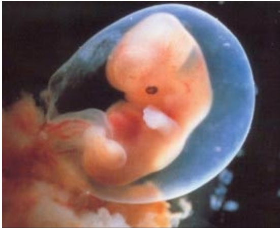
Ungeborenes Kind in der 6. Woche

Sehen Sie hier einen Menschen? Oder sehen Sie nur Schwangerschafts-Gewebe?