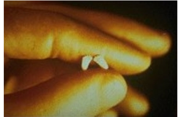
Füße eines ungeborenen Kindes in der 10. Schwangerschaftswoche