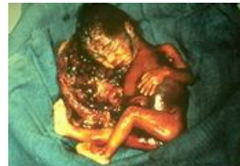
Ungeborene Kinder, ermordet nach der 20. Schwanger- schaftswoche

Und Sie, Herr „Doktor“ ? Sie wissen nicht, was Sie tun ?