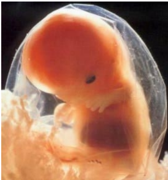
Ungeborenes Kind in der 9. Woche

Ungeborene Kinder sind laut Gesetz bereits erbberechtigt!